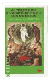
AL TERCER DIA RESUCITO DE ENTRE LOS MUERTOS GONZALEZ FAUS, JOSE IGNACIO