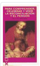
PARA COMPRENDER, CELEBRAR Y VIVIR LA RECONCILIACION Y EL PER BOROBIO, DIONISIO