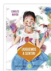
JUGUEMOS A SENTIR! BAYOD SERAFINI