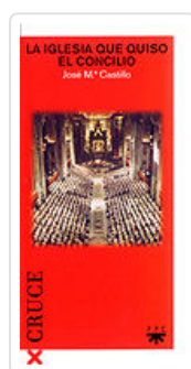
IGLESIA QUE QUISO EL CONCILIO, LA CASTILLO. JOSE M a