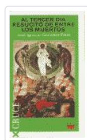
AL TERCER DIA RESUCITO DE ENTRE LOS MUERTOS GONZALEZ FAUS, JOSE IGNACIO