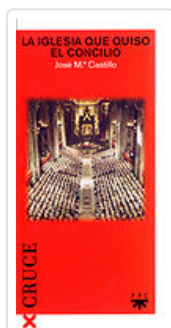
IGLESIA QUE QUISO EL CONCILIO, LA CASTILLO, JOSE Mª