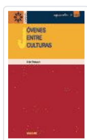
JOVENES ENTRE CULTURAS MASSOT LAFON