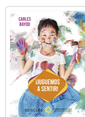
JUGUEMOS A SENTIR! BAYOD SERAFINI