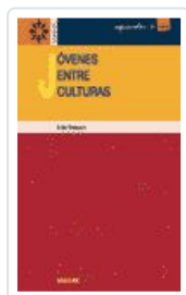
JOVENES ENTRE CULTURAS MASSOT LAFON