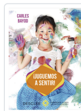
JUGUEMOS A SENTIR! BAYOD SERAFINI