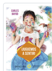
JUGUEMOS A SENTIR! BAYOD SERAFINI