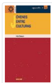
JOVENES ENTRE CULTURAS MASSOT LAFON