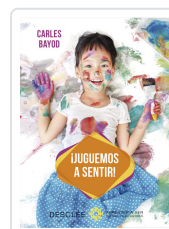
JUGUEMOS A SENTIR! BAYOD SERAFINI