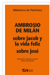
Sobre Jacob y la vida de feliz- Sobre José. nº135 Ambrosio, Santo, Obispo de Milán