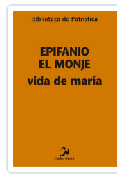
Vida de María Nº 8 Epifanio el Monje