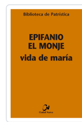
Vida de María Nº 8 Epifanio el Monje