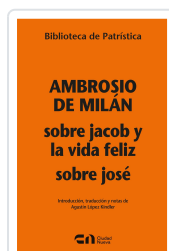
Sobre Jacob y la vida de feliz- Sobre José. nº135 Ambrosio, Santo, Obispo de Milán