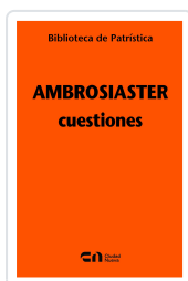
Cuestiones Nº 133 Ambrosiaster