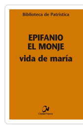
Vida de María Nº 8 Epifanio el Monje