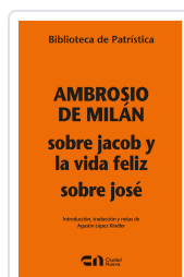
Sobre Jacob y la vida de feliz- Sobre José. nº135 Ambrosio, Santo, Obispo de Milán