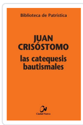
Las catequesis bautismales Juan Crisóstomo