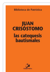
Las catequesis bautismales Juan Crisóstomo