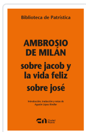
Sobre Jacob y la vida de feliz- Sobre José. n°135 Ambrosio, Santo, Obispo de Milán