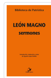
Sermones. Leon Magno n° 139 León Magno