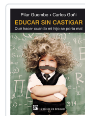
EDUCAR SIN CASTIGAR GUEMBE MAÑERU, PILAR / GOÑI ZUBIETA, CAR