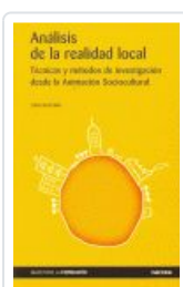
ANALISIS DE LA REALIDAD LOCAL. TECNICAS Y METODOS ESCUDERO, JOSE