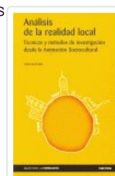
ANALISIS DE LA REALIDAD LOCAL. TECNICAS Y METODOS ESCUDEIRO, JOSE