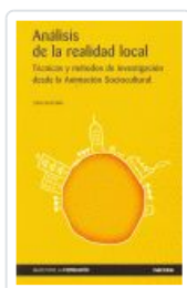
ANALISIS DE LA REALIDAD LOCAL. TECNICAS Y METODOS ESCUDERO, JOSE