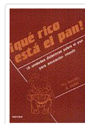
QUE RICO ESTA EL PAN ! BORRETTI