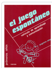
JUEGO ESPONTANEO, EL PUGMIRE-STOY