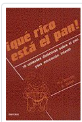
QUE RICO ESTA EL PAN! BORRETTI