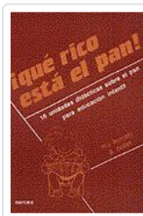
QUE RICO ESTA EL PAN! BORRETTI