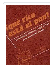
QUE RICO ESTA EL PAN ! BORRETTI