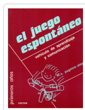
JUEGO ESPONTANEO, EL PUGMIRE-STOY