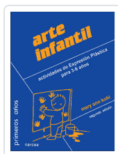
ARTE INFANTIL KOHL, MARY