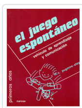
JUEGO ESPONTANEO, EL PUGMIRE-STOY