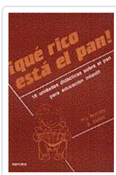
QUE RICO ESTA EL PAN ! BORRETTI