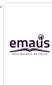
RINCON DE AUDICION, EL VIALA/DESPLATS