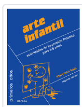
ARTE INFANTIL KOHL, MARY