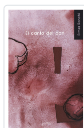
CANTO DEL PAN, EL PAN RONCHI, ERMES