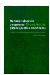
MEMORIA SUBERSIVA Y ESPERANZA PARA LOS PUEBLOS CRUCIFICADOS ALEGRE, XAVIER