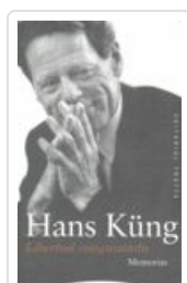
LIBERTAD CONQUISTADA. MEMORIAS HANS KUNG, HANS