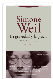
La gravedad y la gracia Weil, Simone