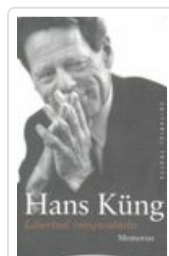
LIBERTAD CONQUISTADA. MEMORIAS HANS KUNG KUNG, HANS