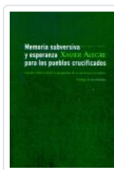
MEMORIA SUBERSIVA Y ESPERANZA PARA LOS PUEBLOS CRUCIFICADOS ALEGRE, XAVIER