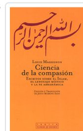
CIENCIA DE LA COMPASION, LA MASSIGNON, LOUIS