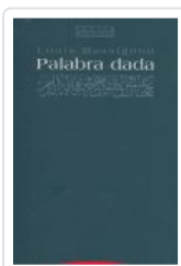
PALABRA DADA MASSIGNON, L