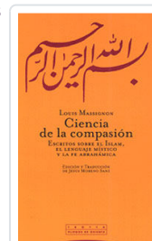
CIENCIA DE LA COMPASION, LA MASSIGNON, LOUIS