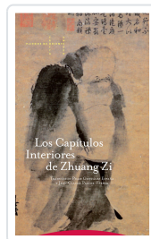
CAPITULOS INTERIORES DE ZHUANG ZI