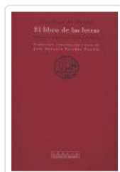
LIBRO DE LAS LETRAS, EL AL FARABI