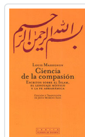
CIENCIA DE LA COMPASION, LA MASSIGNON, LOUIS