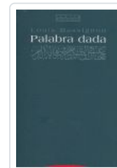
PALABRA DADA MASSIGNON, L