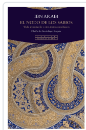
EL NUDO DE LOS SABIOS AA.VV