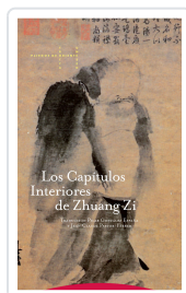
CAPITULOS INTERIORES DE ZHUANG ZI