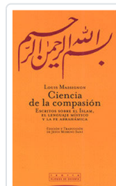
CIENCIA DE LA COMPASION, LA MASSIGNON, LOUIS