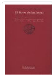
LIBRO DE LAS LETRAS, EL AL FARABI