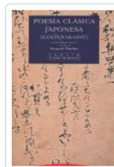
POESIA CLASICA JAPONESA DUTHIE, TORQUIL