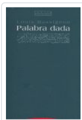
PALABRA DADA MASSIGNON, L