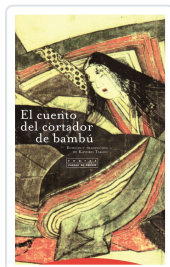
CUENTO DEL CORTADOR DE BAMBÚ TAKAGI