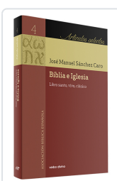
Biblia e Iglesia Sánchez Caro, José Manuel