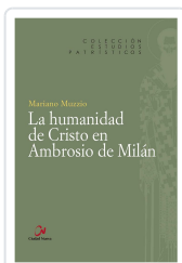
HUMANIDAD DE CRISTO EN AMBROSIO DE MILAN HERNAN MUZZIO, MARIANO