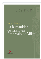
HUMANIDAD DE CRISTO EN AMBROSIO DE MILAN HERNAN MUZZIO, MARIANO