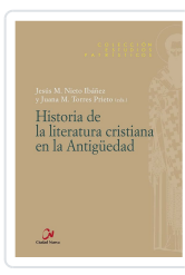
HISTORIA DE LA LITERATURA CRISTIANA EN LA ANTIGÜEDAD NIETO IBÁÑEZ, JESÚS M / TORRES PRIETO, J