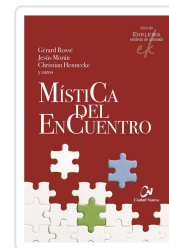
MISTICA DEL ENCUENTRO ROSSE, G. / MORAN, J. / HEMMERLE, C.