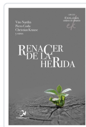
RENACER DE LA HERIDA NARDIN/CODA