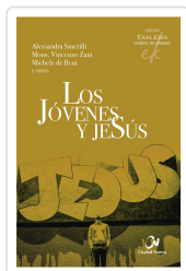
JOVENES Y JESUS, LOS SMERILLI, A. / ZANI, V. / DE BENI, M.