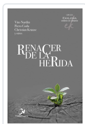
RENACER DE LA HERIDA NARDIN/CODA