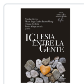
IGLESIA ENTRE LA GENTE STEEVES, NICOLAS / PATRON WONG, CARLOS..