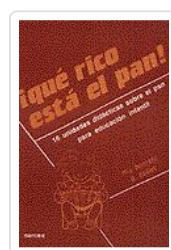
QUE RICO ESTA EL PAN ! BORRETTI