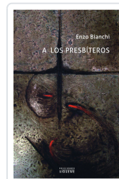
A LOS PRESBITEROS BIANCHI, ENZO