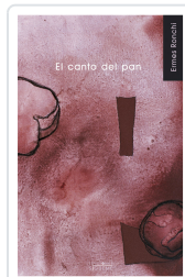
CANTO DEL PAN, EL RONCHI, ERMES