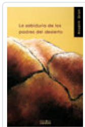
SABIDURIA DE LOS PADRES DEL DESIERTO, LA GRUN, ANSELM