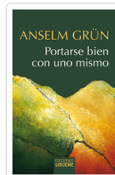
PORTARSE BIEN CON UNO MISMO (NUEVO) GRUN, ANSELM