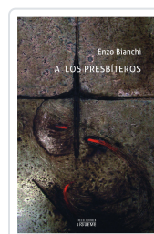
A LOS PRESBITEROS BIANCHI, ENZO