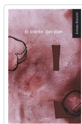
CANTO DEL PAN, EL RONCHI, ERMES