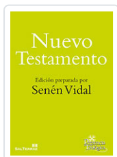
NUEVO TESTAMENTO (ST) n°217 VIDAL, SENEN