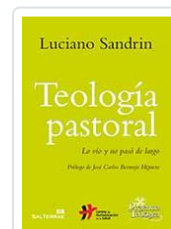
TEOLOGIA PASTORAL. n°220 SANDRIN, LUCIANO