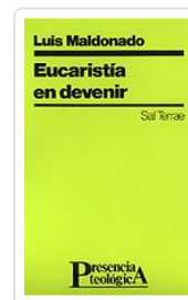
EUCARISTIA EN DEVENIR n°87 MALDONADO, LUIS