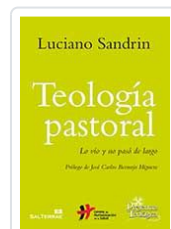
TEOLOGIA PASTORAL. nº220 SANDRIN, LUCIANO