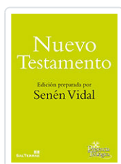
NUEVO TESTAMENTO (ST) n°217 VIDAL, SENEN