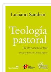
TEOLOGIA PASTORAL. n°220 SANDRIN, LUCIANO