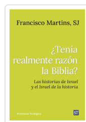
Tenía realmente razón la Biblia? nº321 Martins SJ, Francisco