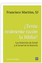
Tenía realmente razón la Biblia? nº321 Martins SJ, Francisco