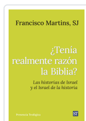
Tenía realmente razón la Biblia? n°321 Martins SJ, Francisco