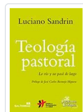
TEOLOGIA PASTORAL. n°220 SANDRIN, LUCIANO