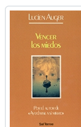
Vencer los miedos nº 35 Auguer, Lucien