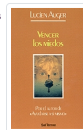
Vencer los miedos nº 35 Auguer, Lucien