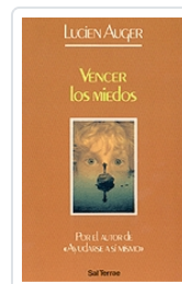
Vencer los miedos n° 35 Auguer, Lucien