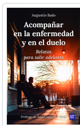
ACOMPañAR EN LA ENFERMEDAD Y EN EL DUELO N°165 AUGUSTIN BADO