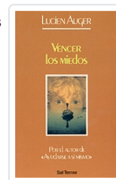
Vencer los miedos nº 35 Auguer, Lucien