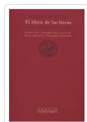
LIBRO DE LAS LETRAS, EL AL FARABI