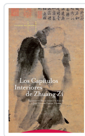
CAPITULOS INTERIORES DE ZHUANG ZI