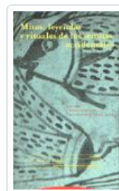
MITOS, LEYENDAS Y RITUALES DE LOS SEMITAS OCCIDENTALES DEL OLMO LETE