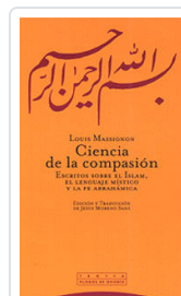
CIENCIA DE LA COMPASION, LA MASSIGNON, LOUIS